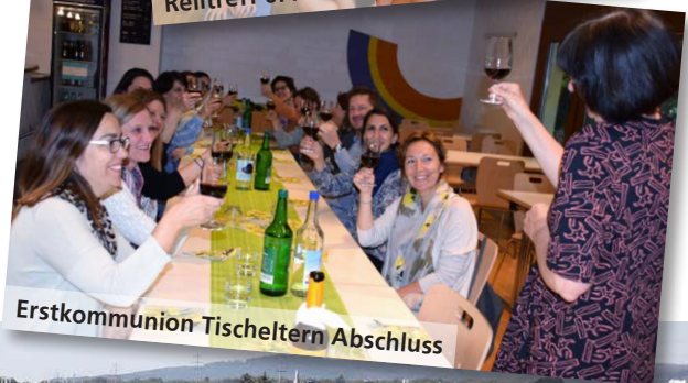
Erstkommunion Tischeltern Abschluss