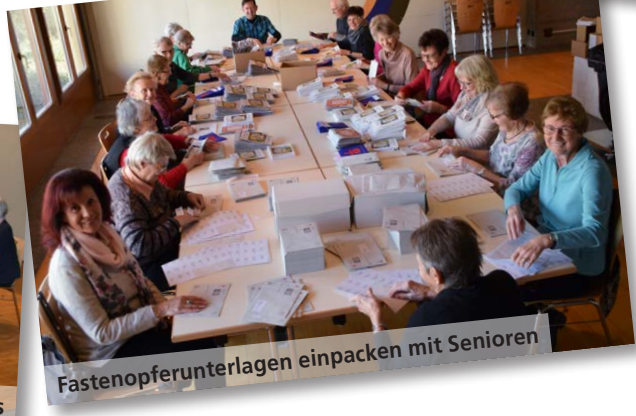
Fastenopferunterlagen einpacken mit Senioren