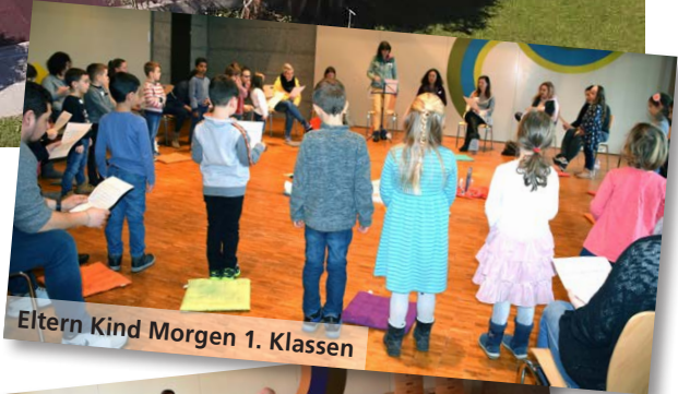
Eltern Kind Morgen 1. Klassen