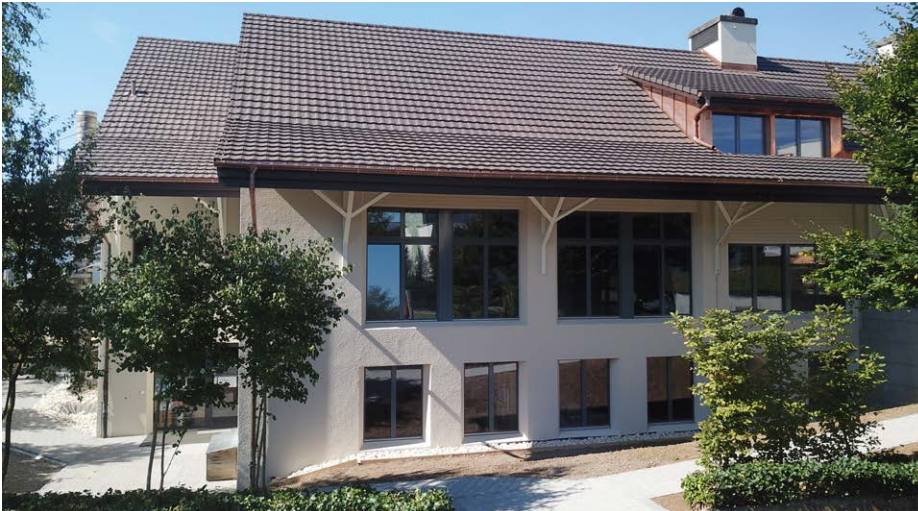
Aussenansicht Pfarreizentrum Schallen nach erfolgter Renovation