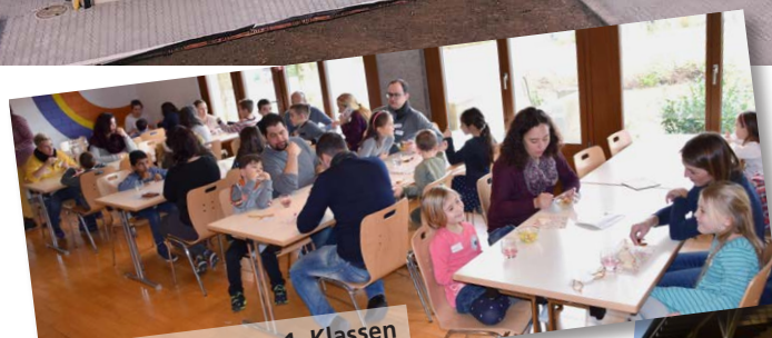
Eltern Kind Morgen 1. Klassen