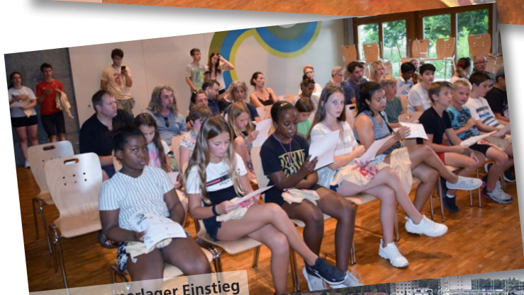
JuBla Sommerlager Einstieg