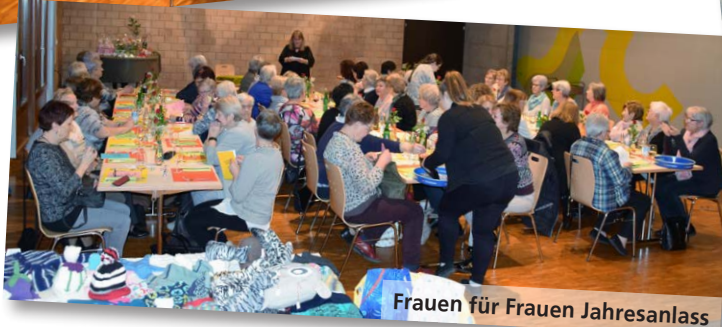
Frauen für Frauen Jahresanlass