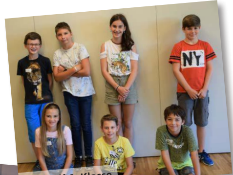
Relitreff 6. Klasse